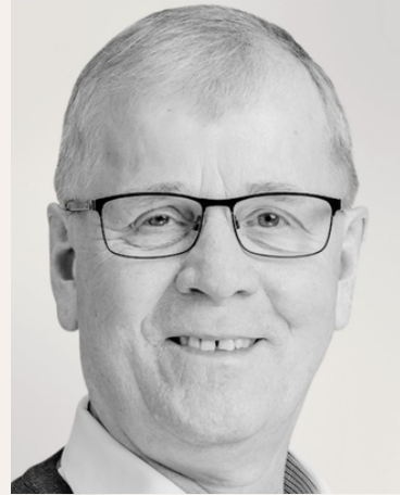
Arne Sigtenbjerg gaard